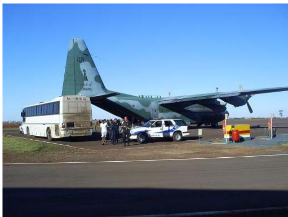
A Força Aérea Brasileira tem apoiado as remoções por meio de suas aeronaves

As transferências para o Sistema Penitenciário Federal foram regulamentadas por meio da Resolução nº 502/2006 do Conselho da Justiça Federal que atribui a Justiça Federal a competência para deliberar acerca das remoções.