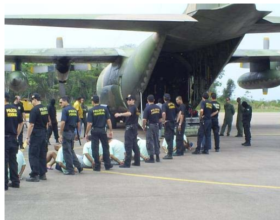
Presos da Penitenciária “Urso Branco” sendo embarcados em Rondônia

Sobre o que se convencionou denominar “perfil” do preso, restou consolidado que a transferência para as Penitenciárias Federais é medida que se justifica no interesse da segurança pública ou da própria pessoa presa, nos termos das Leis nº 7.210, de 11/07/1984 e nº 8.072, de 25/07/1990.