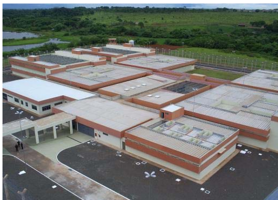
Foto Panorâmica da Penitenciária Federal de Campo Grande/MS

A segunda unidade Federal foi inaugurada em 21/12/2006 no Município de Campo Grande, Estado do Mato Grosso do Sul. A unidade está em fase final de testes e instalação de equipamentos com vistas a entrar em operação em breve.