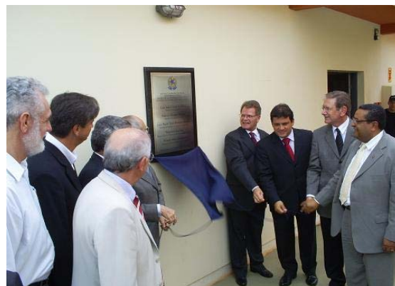
Cerimônia de Inauguração da Penitenciária Federal de Campo Grande/MS

A terceira Penitenciária Federal está sendo edificada no Município de Mossoró, Estado do Rio Grande do Norte (contrato nº 004/2005). As obras encerraram o exercício (ref. Dez/06) com percentual de execução física em torno de 60%. A previsão para conclusão das obras é junho de 2007.