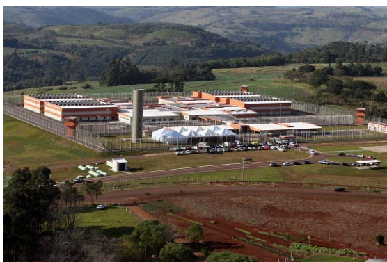
Foto panorâmica da Penitenciária Federal de Catanduvas/PR

A primeira Penitenciária Federal foi inaugurada em 23/06/2006 no Município de Catanduvas, Estado do Paraná. A unidade encontra-se em plena operação e encerrou o exercício com uma população prisional de 113 (cento e treze) presos.